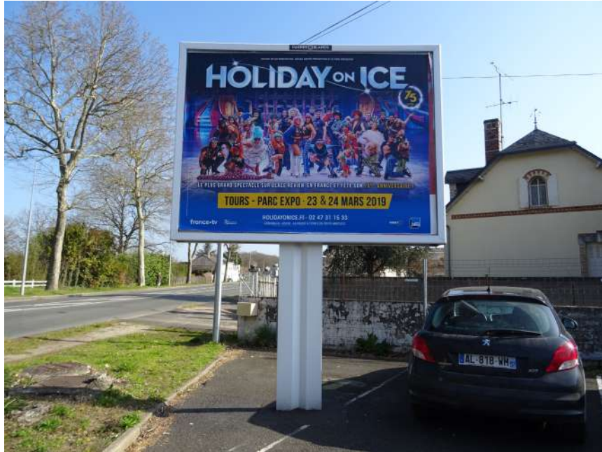
Publicité scellée au sol

PUBLICITE: toute inscription, forme ou image, destinée à informer le public ou à attirer son attention