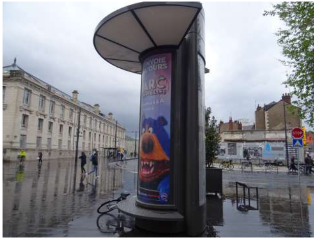
Colonnes et mâts porte affiches

Le RLP réglemente les publicités installées sur propriétés privées, comme sur domaine public (notamment sur mobilier urbain)