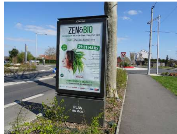
Mobiliers d'information à caractère général ou local (avec publicité 2 et 8m 2 )