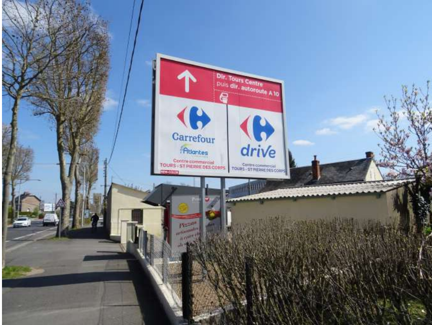
Préenseigne scellée au sol

PREENSEIGNES: toute inscription, forme ou image, indiquant la proximité d'une activité déterminée