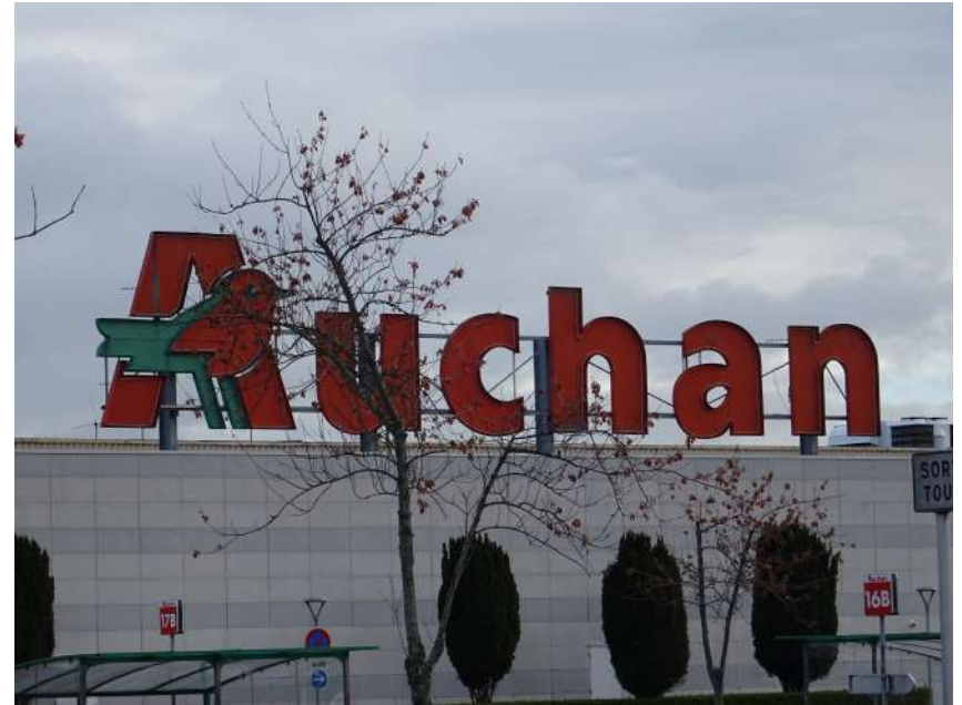
Enseigne en toiture

Dès lors qu'il existe un RLP, toute installation ou modification d'enseigne est soumise à AUTORISATION PREALABLE du Maire