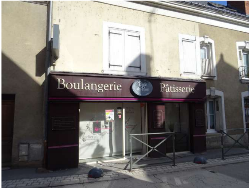
Enseignes parallèles et perpendiculaires à la façade

ENSEIGNES: toute inscription, forme ou image, apposée sur un immeuble et relative à l'activité qui s'y exerce