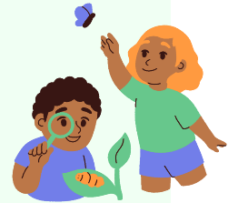
Balades dans les parcs