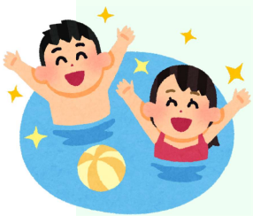
Piscine, jeux d'eau